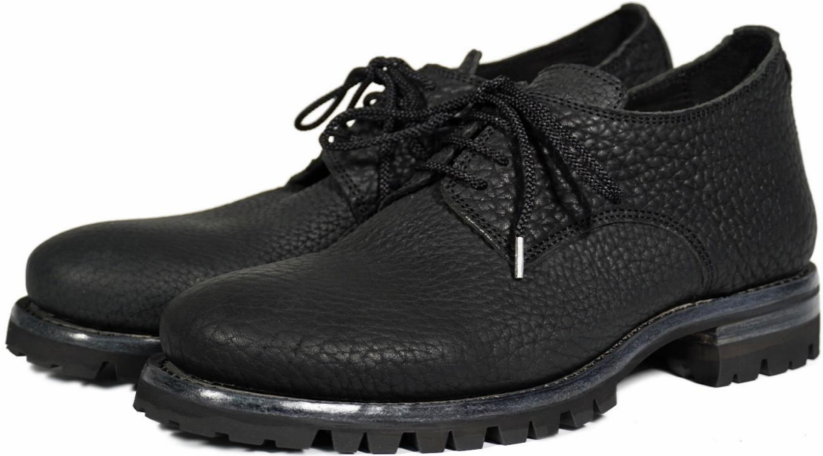
material : Bull shrink / black

品番 Mens M19v4-L3BLR1100 Womens F19v4-L3BLR1100