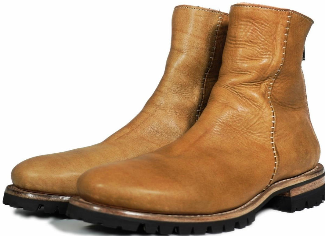
material : CANYON / sand

品番 Mens M37OL-L3BLR1100 Womens F37OL-L3BLR1100