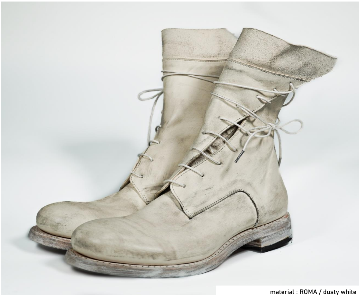
material : ROMA / dusty white